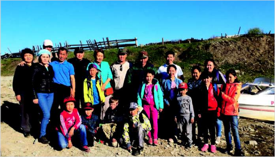
Проект «Юные хранители природы»