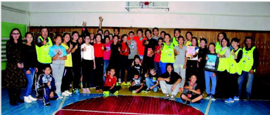
Проект «Спортивная семья»