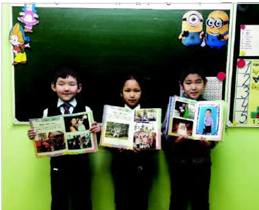
МБОУ Качикатская СОШ» ПРОЕКТ «МОЯ СЕМЬЯ»