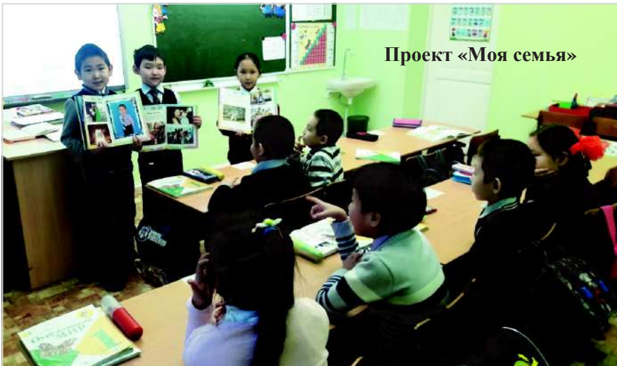
Проект «Моя семья»