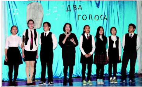
Проект «Поющий класс»