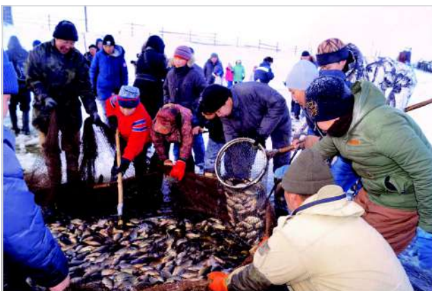
МБОУ «Ойская СОШ» ПРОЕКТ «ОЛУК УТУМА – НА- СЛЕДИЕ ПРЕД- КОВ»