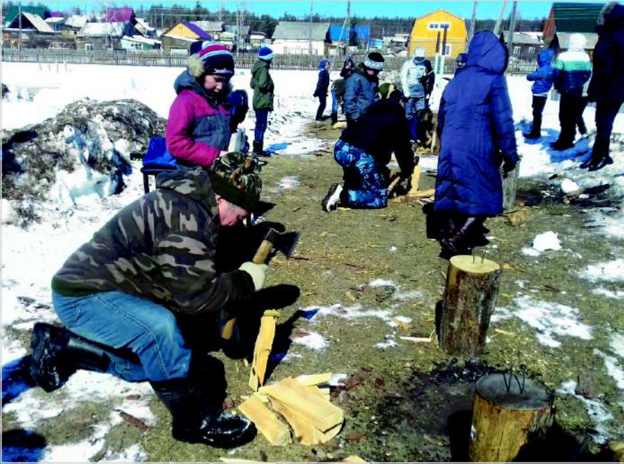
ПРОЕКТ 4 класса «АБА УОННА УОЛ», 2016 г.