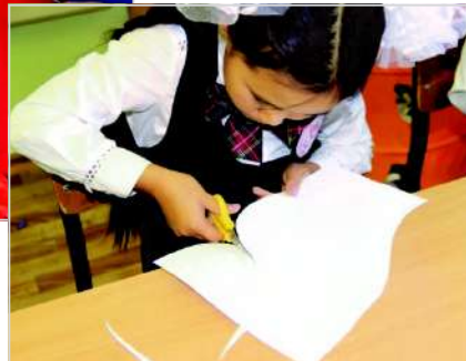
Проект «Мой мир»