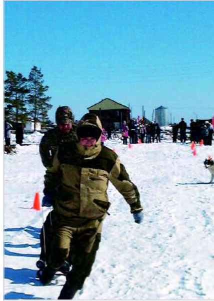
ПРОЕКТ «АБА УОННА УОЛ» с. БУЛГУННЯХТАХ