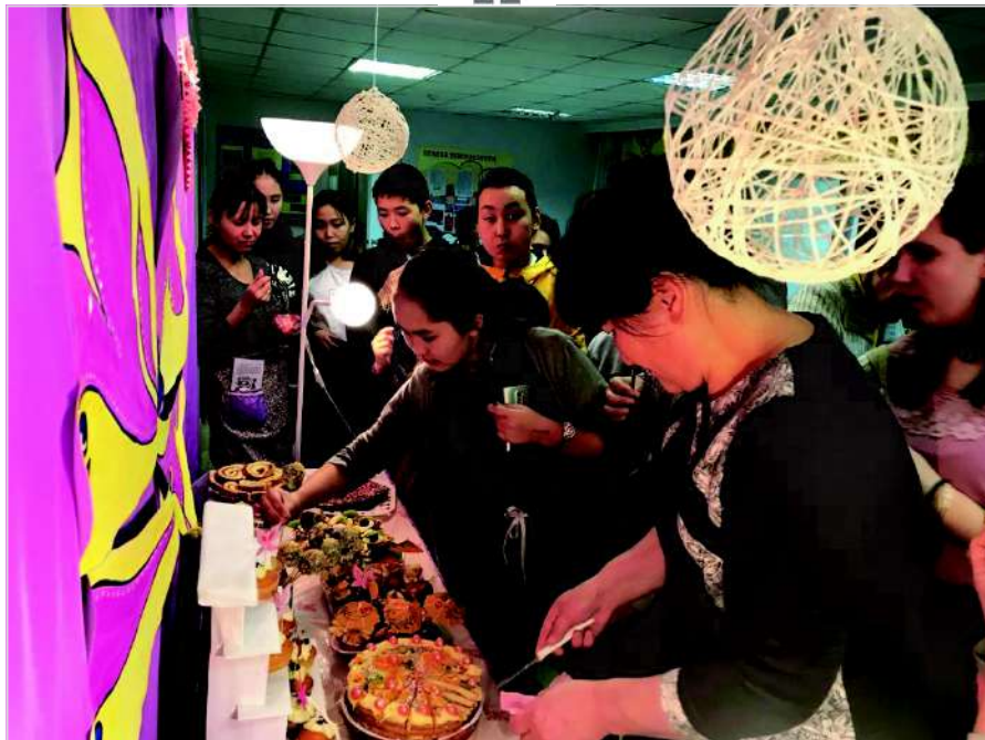
Мастер класс родителей по оформлению кэнди-бара