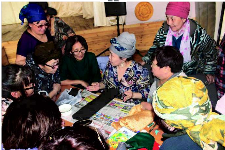
МБОУ «Едйская СОШ» ПРОЕКТ «СЧАСТЛИВАЯ СЕМЬЯ – СЧАСТЛИВЫЕ ДЕТИ»